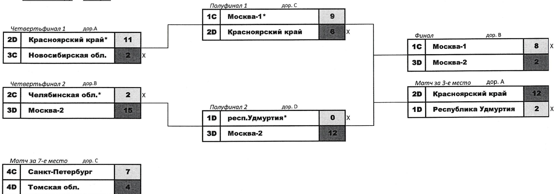
Схема плей-офф Юниорки

* - команда выбирает очередность разминки или цвет камней, либо очередность броска в соответствии с п.9.7.7 Правил