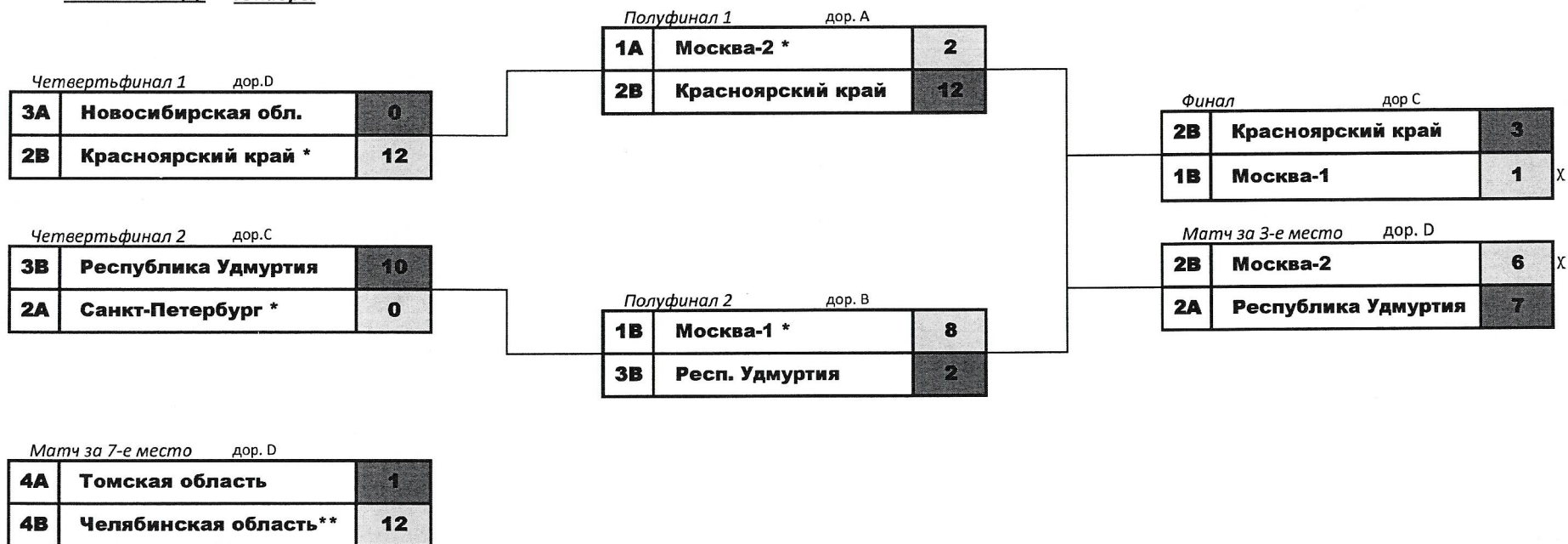
Схема плей-офф Юниоры

* - получает выбор цвета камней и выбор первого или второго броска в первом энде п.8.7.8.